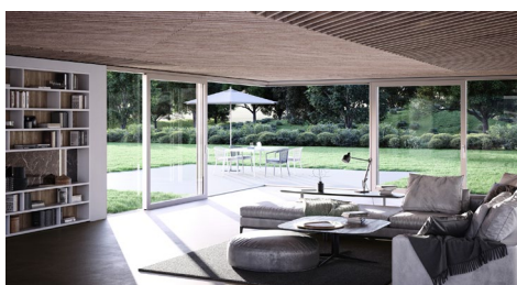
[Wohnwelten_heroal S 77 SL_Ecke zum Öffnen]

heroal si presenta al BAU 2023 con soluzioni innovative di Smart Home e Smart Building. Con l'aletta di ventilazione heroal W 72 VF possono essere realizzati sistemi di ventilazione naturale controllata.