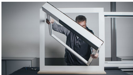
[Einfache Montage_heroal Ready VS Z EM]

Per garantire massima efficienza di produzione e montaggio, heroal ha messo a punto tre prodotti innovativi, presentati al BAU 2023 mediante dimostrazioni live che ne illustrano la semplice realizzazione.