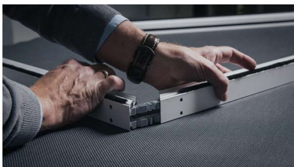
[heroal Ready VS Z EM_Montage_Schritt 2]

Sans papier et gain de temps : dans le configurateur heroal Business, les partenaires spécialisés heroal peuvent créer des offres et passer des commandes de manière numérique.