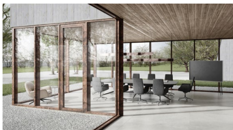
[heroal 06 Fassade Fenstertür heroal SD Rost_C 50, W 72_A4.jpg]

Progettare in architettura: la disponibilità di sistemi in alluminio che possono essere combinati tra loro con armonia in un'ampia varietà di design e colori consente di realizzare progetti architettonici unici.