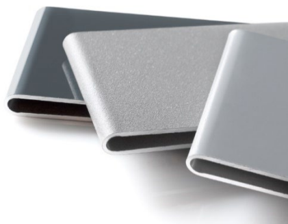
[heroal Oberfläche Glanzgrade.jpg]

Progettare in architettura: la disponibilità di sistemi in alluminio che possono essere combinati tra loro con armonia in un'ampia varietà di design e colori consente di realizzare progetti architettonici unici.